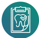
Schéma dentaire interactif

Retrouvez les antécédents patients dans votre réseau de centres